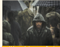
/Une pluie sans fin /

Le Poirier sauvage était en compétition au Festival de Cannes 2018. Lauréat de la Palme d'Or en 2014 avec Winter Sleep , Nuri Bilge Ceylan est reparti malheureusement bredouille cette année.