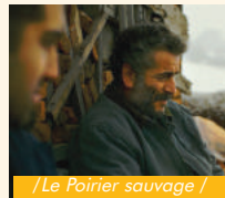
/Le Poirier sauvage /