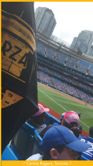
/ Centre Rogers, Toronto /

Nous publierons les 10 meilleures et offrirons 2 places à leurs auteur/res dès la réouverture !